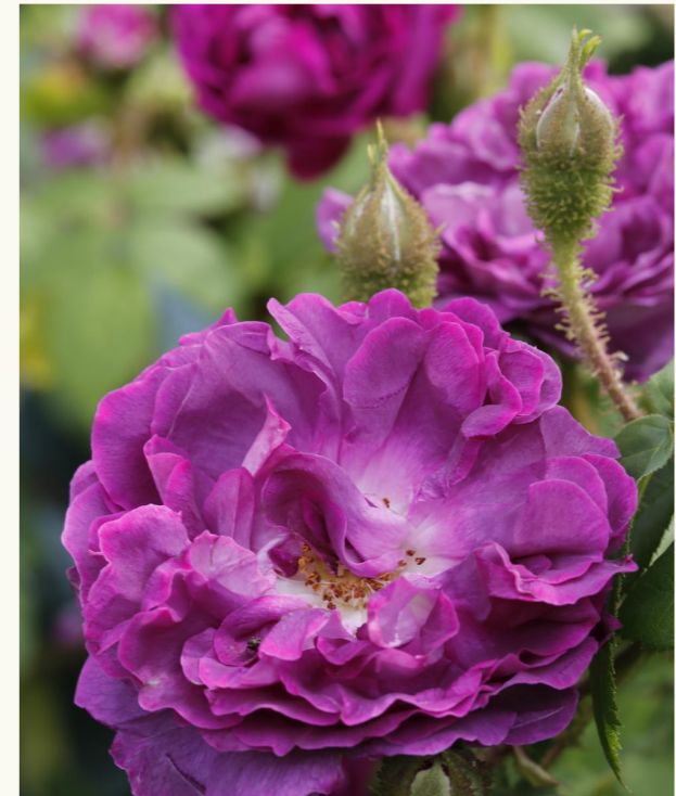
'William Lobb' -sammalruusun tummissa kukissa on väkevä tuoksu.