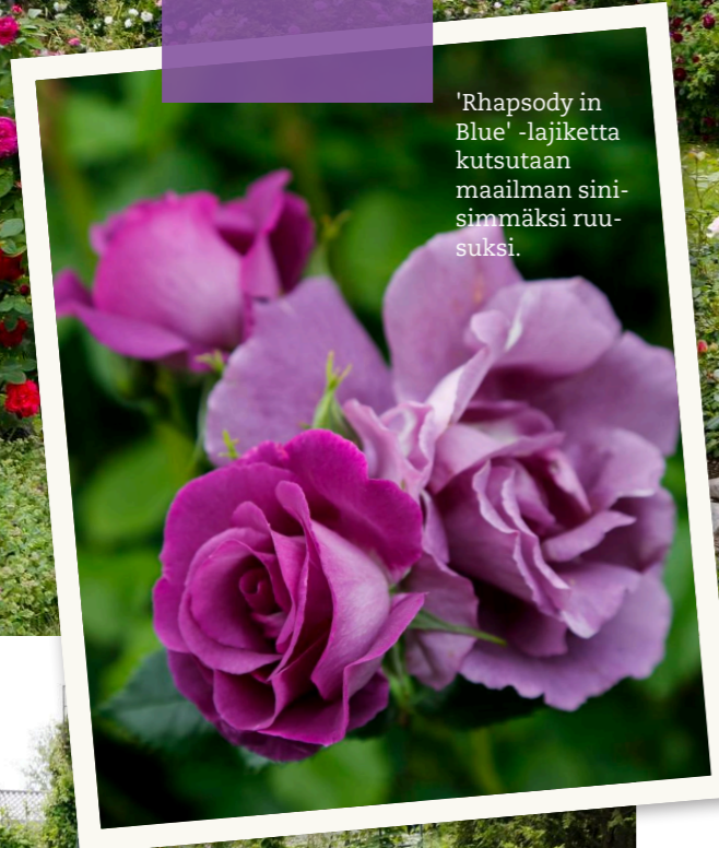
'Rhapsody in Blue' -lajiketta kutsutaan maailman sinisimmäksi ruusuksi.