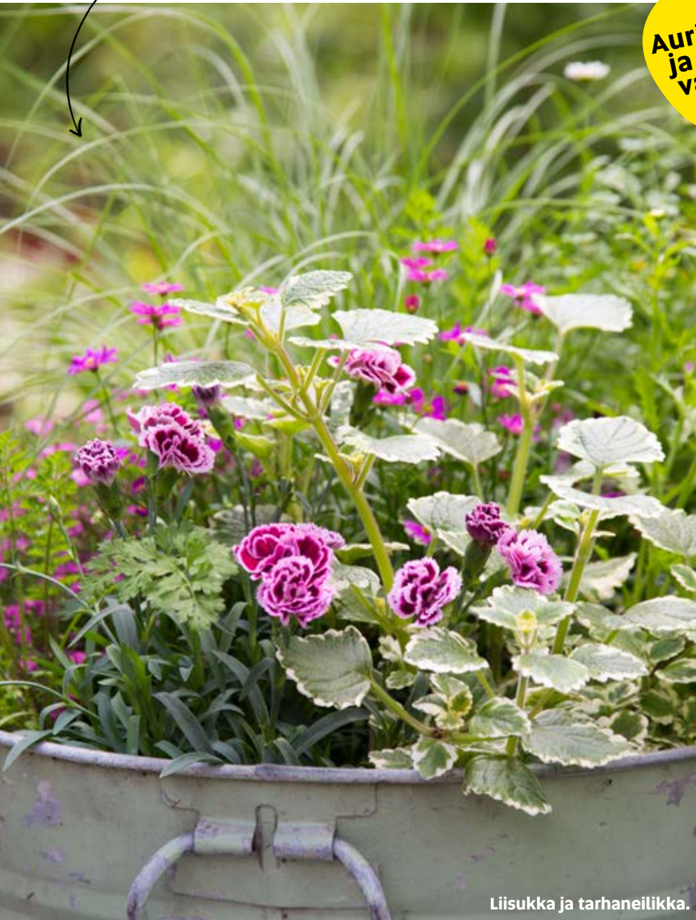
Liisukka ja tarhaneilikka.