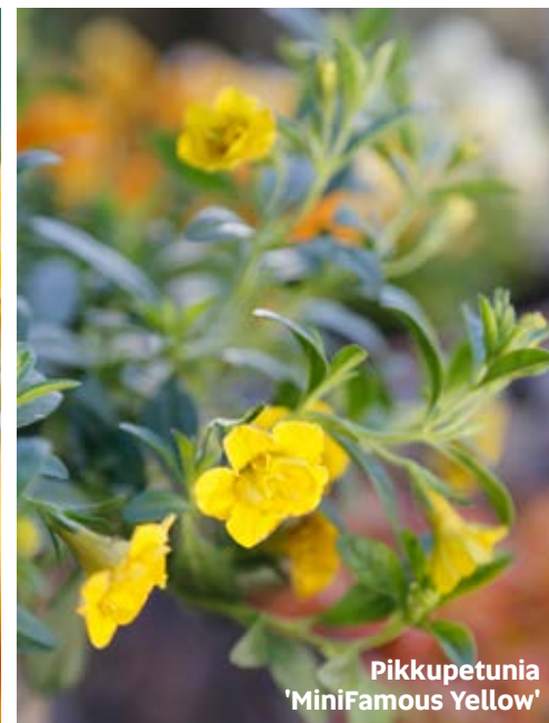
Pikkupetunia 'MiniFamous Yellow'